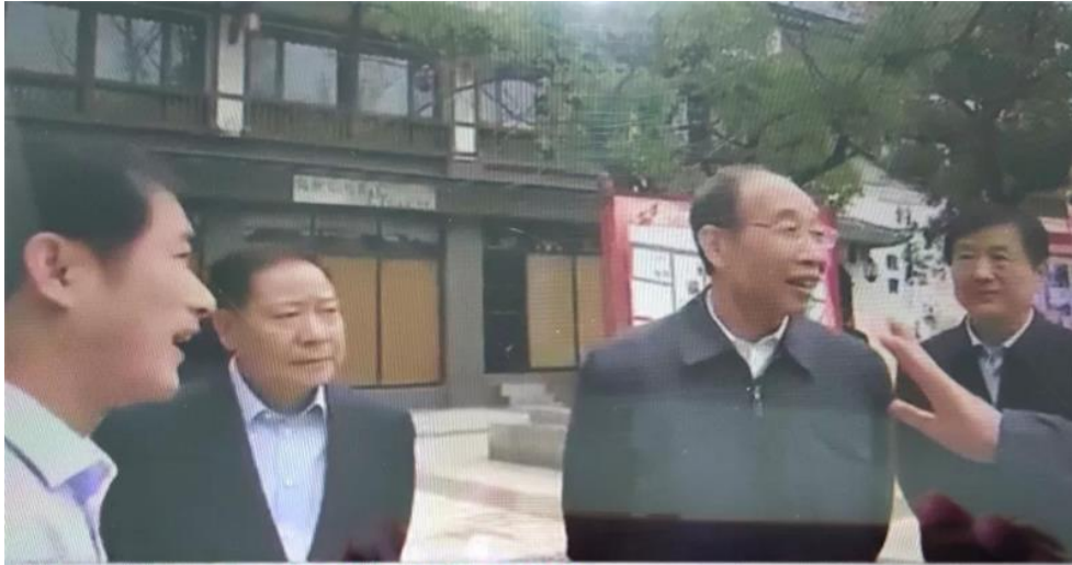
尤权在江西调研时强调： 深入学习贯彻党的十九届四中全会精神 加强和改进新时代统战工作 张裔炯随同调研 刘奇在南昌陪同调研

11月11日至13日，中共中央书记处书记、中央统战部部长尤权赴江西调研，强调要深入学习贯彻党的十九届四中全会精神和习近平总书记关于加强和改进统一战线工作的重要思想，进一步健全完善统战工作体制机制，努力推动新时代统战工作高质量发展。中央统战部常务副部长张裔炯和江西省领导陪同调研。尤权来到南昌、赣州，走访宗教活动场所了解当地宗教工作情况，深入社区、楼宇考察基层统战工作创新情况，详细向南昌市里州社区新的社会阶层人士工作站章建金站长了解社区新的社会阶层工作开展情况、询问税务师事务所工作内容，对下一步新的社会阶层工作指明了方向。