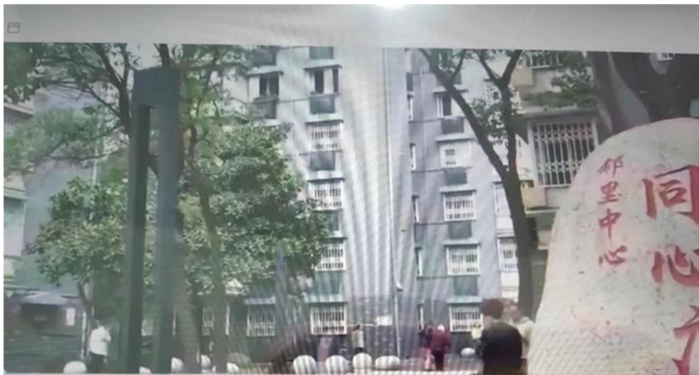
尤权在江西调研时强调： 深入学习贯彻党的十九届四中全会精神 加强和改进新时代统战工作 张裔炯随同调研 刘奇在南昌陪同调研